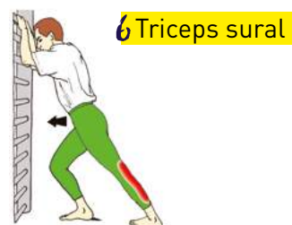
6 Triceps sural